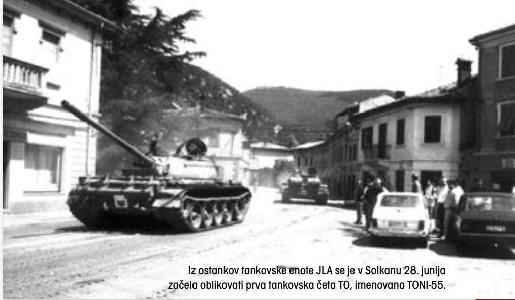
Iz ostankov tankovske enote JLA se je v Solkanu 28. junija začela oblikovati prva tankovska četa TO, imenovana TONI-55.