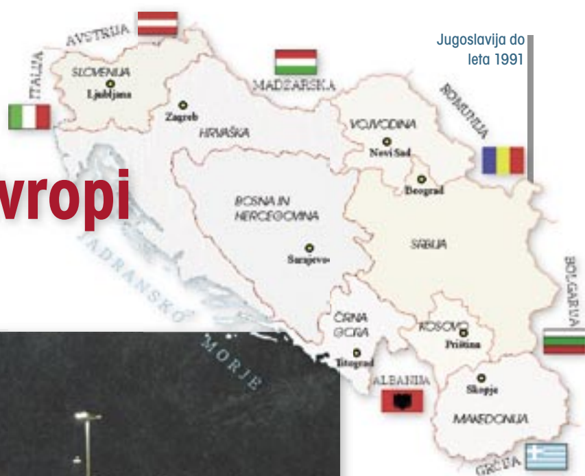
Jugoslavija do leta 1991