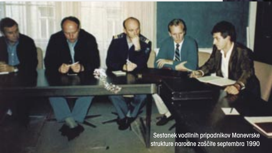
Sestanek vodilnih pripadnikov Manevske strukture narodne zaščite septembra 1990

Tajno skladišče orožja v vodnjaku v vasi Libušnje na Tolminskem. Med projektom MSNZ je bilo na najrazličnejših krajih mnogo tajnih skladišč orožja in streliva, namenjenih enotam MSNZ, za katera so skrbeli le najbolj zanesljivi posamezniki.