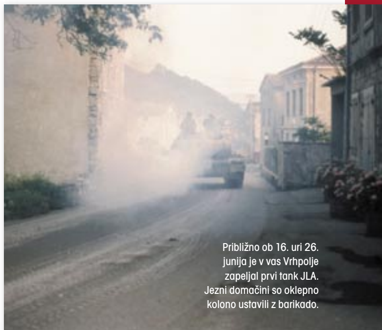
Približno ob 16. uri 26. junija je v vas Vrhpolje zapeljal prvi tank JLA. Jezni domačini so oklepno kolono ustavili z barikado.