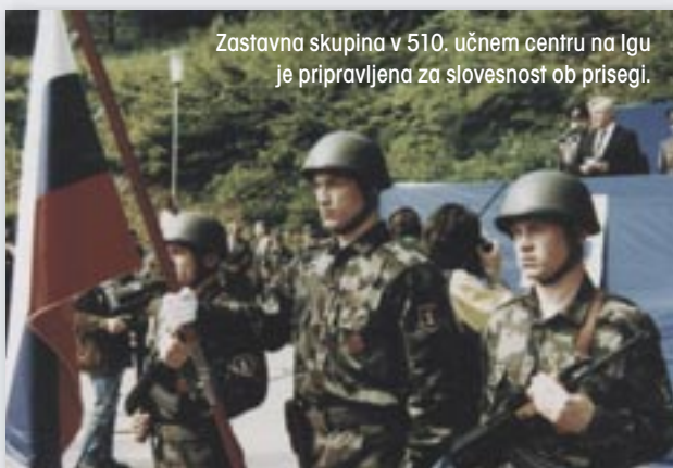
Zastavna skupina v 510. učnem centru na Igu je pripravljena za slovesnost ob prisegi.

V učni center na Ig pri Ljubljani je prišlo 180 nabornikov, v Pekre pri Mariboru pa 120. Vojaški rok so služili v posodobljenih vojašnicah, vzpostavljeni so bili dobri odnosi in ustvarjeni temelji, na katerih so gradili spoštovanje vojaške osebnosti. Prvi mirnodobni vojaki so domovini prisegli 2. junija 1991.