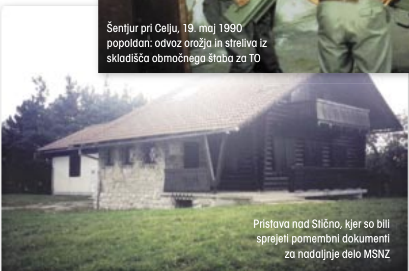
Pristava nad Stično, kjer so bili sprejeti pomembni dokumenti za nadaljnje delo MSNZ

Že januarja 1990 je komandant Teritorialne obrambe RS generalpodpolkovnik Ivan Hočevar od podrejenih štabov za Teritorialno obrambo zahteval, naj posredujejo podatke o količini in vrsti orožja, ki je bilo v vojašnicah JLA. Podatke je Republiški štab za Teritorialno obrambo Republike Slovenije potreboval, ker je hotel vedeti, koliko in kakšne vrste oborožitve ter streliva je v občinskih, pokrajinskih in zaščitni brigadi TO. Na podlagi dobljenih podatkov je bil 15. maja 1990 izdan ukaz o takojšnji premestitvi orožja, streliva in minskoeksplozivnih sredstev v skladišča JLA. Nalogo so morali opraviti v popolni tajnosti. O ukazu ni bil obveščen nihče iz republiškega vodstva. To je pomenilo razorožitev Teritorialne obrambe Republike Slovenije. Priprave na odvzem orožja, ki so potekale že nekaj mesecev prej, so bile načrtovane za konec mandata predsednika Predsedstva SFRJ Janeza Drnovška in ob zamenjavi vlade v Republiki Sloveniji.