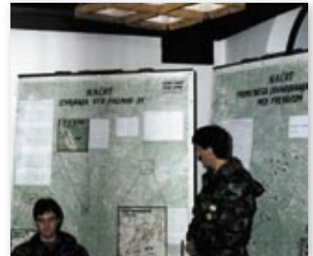
Vajo Premik-91 je vodil Republiški štab za Teritorialno obrambo Republike Slovenije.

pa je bila Šmarjeta na Dolenjskem. Med premikom enot je potekalo veliko dejavnosti. Tako je enota sodelovala v protiletalskem in protihelipterskem boju, v Starem Logu na Kočevskem se je spopadla s postavljenimi zasedi, poleg tega je pregledala teren, saj je obstajala nevarnost sovražnih izvidniških diverzantskih skupin.