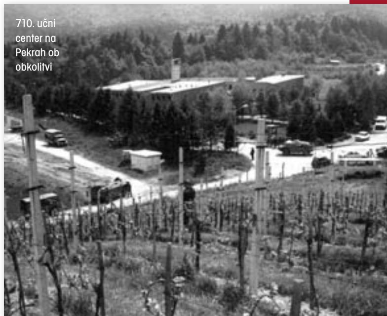
710. učni center na Pekrah ob obkolitvi

Enote JLA so kljub težavam bolj ali manj uspešno uresničile ukaz. Z oklepniki so zasedle več mejnih prehodov.