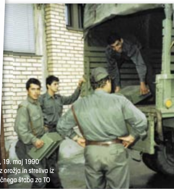
Šentjur pri Celju, 19. maj 1990 popoldan: odvoz orožja in streliva iz skladišča območnega štaba za TO

Že januarja 1990 je komandant Teritorialne obrambe RS generalpodpolkovnik Ivan Hočevar od podrejenih štabov za Teritorialno obrambo zahteval, naj posredujejo podatke o količini in vrsti orožja, ki je bilo v vojašnicah JLA. Podatke je Republiški štab za Teritorialno obrambo Republike Slovenije potreboval, ker je hotel vedeti, koliko in kakšne vrste oborožitve ter streliva je v občinskih, pokrajinskih in zaščitni brigadi TO. Na podlagi dobljenih podatkov je bil 15. maja 1990 izdan ukaz o takojšnji premestitvi orožja, streliva in minskoeksplozivnih sredstev v skladišča JLA. Nalogo so morali opraviti v popolni tajnosti. O ukazu ni bil obveščen nihče iz republiškega vodstva. To je pomenilo razorožitev Teritorialne obrambe Republike Slovenije. Priprave na odvzem orožja, ki so potekale že nekaj mesecev prej, so bile načrtovane za konec mandata predsednika Predsedstva SFRJ Janeza Drnovška in ob zamenjavi vlade v Republiki Sloveniji.